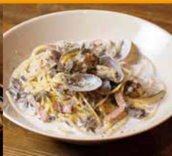
クラムチャウダー