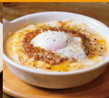
ミートドリア ※ごはん大盛りはできません