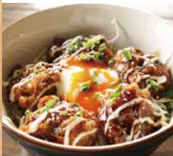
甘辛ダレの照りマヨ唐揚げ丼