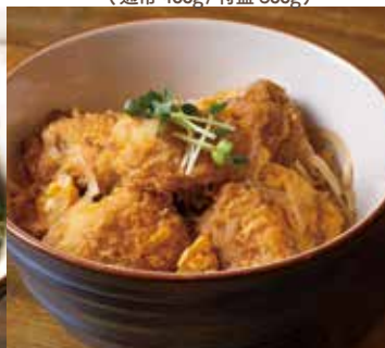
カキフライの卵とじ丼