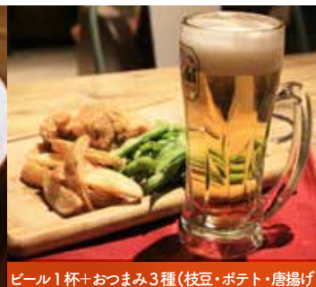
ビール1杯+おつまみ3種(枝豆・ポテト・唐揚げ) おつまみ&ビールセット (ノンアルビールもご用意できます)